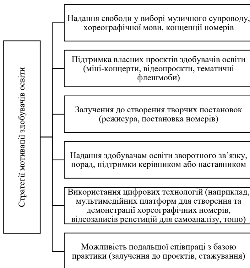
Рис. 2. Ефективні стратегії мотивації здобувачів освіти під час проходження виробничої практики з хореографії