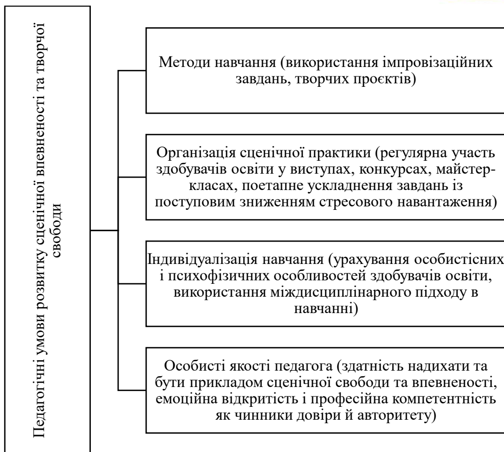
Рис. 2. Педагогічні умови розвитку сценічної впевненості та творчої свободи здобувачів хореографічної освіти

Таким чином, провідним у процесі розвитку творчого потенціалу є практичний етап, оскільки саме він забезпечує реалізацію та вдосконалення педагогічних і хореографічно-виконавських умінь. До його змісту належать сформованість і відпрацьованість різних видів танцювальної техніки, розвиток артистизму, оволодіння виконавським процесом, здатність до перевтілення та передачі художніх образів, а також набуття навичок хореографічної імпровізації.