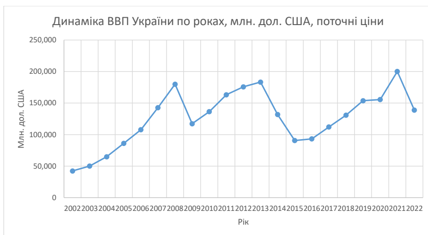
Рис. 1. Динаміка ВВП України по роках, млн. дол. США, поточні ціни, дані Світового банку, МВФ, Держстату та Мінфіну України

чином (рис. 1, 2.). Більш предметна оцінка циклічної компоненти цих трендів потребує окремого розгляду та відповідного ґрунтовного статистичного аналізу. При цьому під впливом різних чинників фактичні рівні динамічного ряду відхиляються від теоретично визначеної основної тенденції розвитку. Ці відхилення можуть мати систематичний (або закономірний) характер, тобто повторюватися через певні інтервали часу, чи випадковий характер. Зауважимо, що для конкретного ряду характерним може бути поєднання систематичних і випадкових коливань.