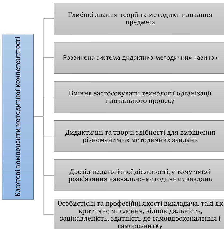
Рис. 3. Ключові компоненти методичної компетентності викладача

Важливим є також формування методичної компетентності у викладачів в умовах інклюзивної освіти. Методична компетентність визначається вмінням використовувати різноманітні методи навчання, засвоєнням дидактичних методів і прийомів, а також застосуванням їх у процесі навчання, що передбачає знання психологічних механізмів засвоєння знань і навичок. Ключовими компонентами методичної компетентності викладачів є (рис. 3):