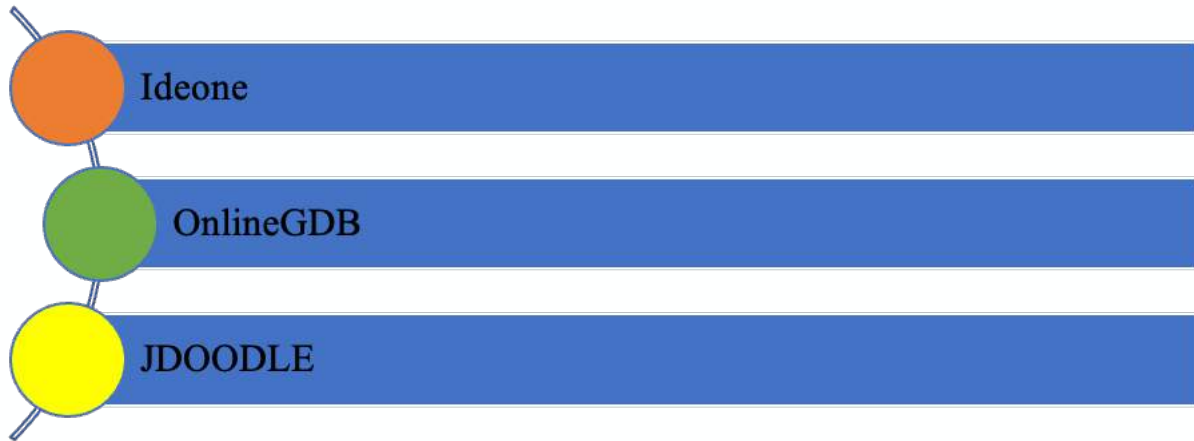
Рис. 1 Найбільш популярні серед користувачів онлайн-компілятори

На рисунку 1 наведені три найпопулярніші серед користувачів онлайн-компілятори для мов програмування Python, C++ та Java.